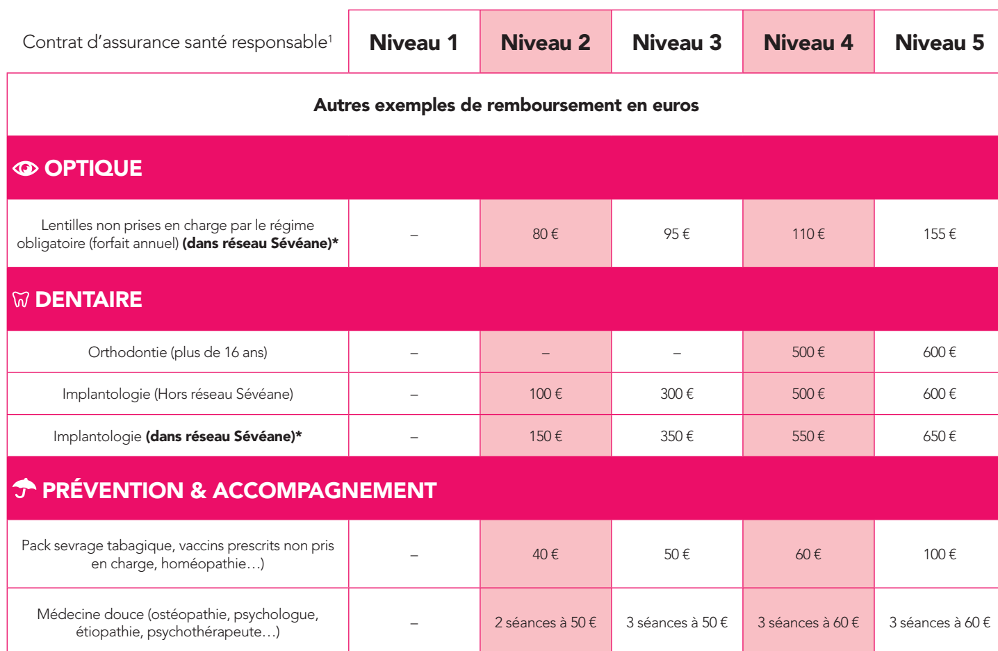
Tableau de garanties du contrat Gan Santé